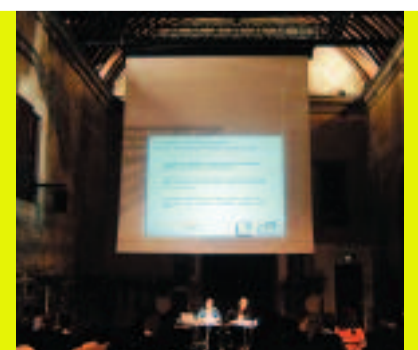
20.10.06 Atelier de l'organisation Les 3 e vendredi du mois de 8h30 à 10h30. Ouverts à tous sur inscription.