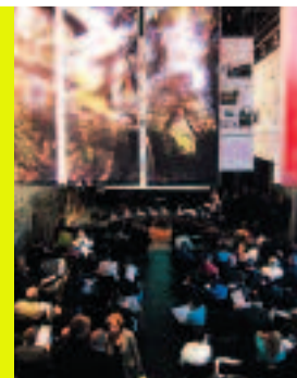
02.05.06 Fabrique du territoire : les aménageurs privés

02.06.06 Promenades là-bas : Christian de Portzamparc présente la Cidade da musica à Rio de Janeiro