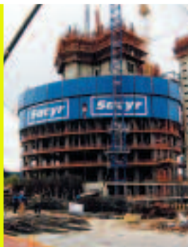
3-6.5.06 Voyage à Madrid