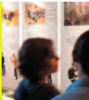
19.04.06 Fabrique de la commande : le concours privé

Venez ! Adhérez ! La Maison de l'architecture en Île-de-France est une association loi 1901, sans but lucratif. Adhérer, c'est l'aider à maintenir sa liberté de choix et d'action. www.maisonarchitecture-idf.org tél. 01 53 26 10 85